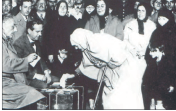
1935 Milletvekili Seçimlerinde Vatandaşlar Oy Kullanırken

Bu fotoğraf dikkate alındığında Cumhuriyetin ilk yılları için,