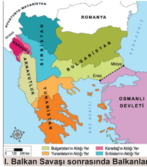
I. Balkan Savaşı sonrasında Balkanlar

Bu haritalara göre I. Balkan Savaşı'nın sonuçları ile ilgili aşağıdakilerden hangisi söylenemez?