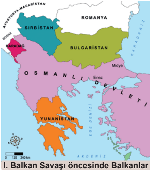
I. Balkan Savaşı öncesinde Balkanlar